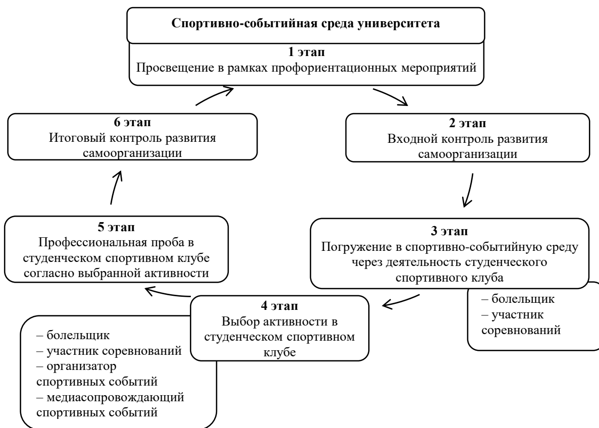
Рис. 2. Технология развития самоорганизации будущих педагогов в спортивно-событийной среде университета

деятельность которого позволяет студентам ощутить собственную причастность к спортивной команде и университету.