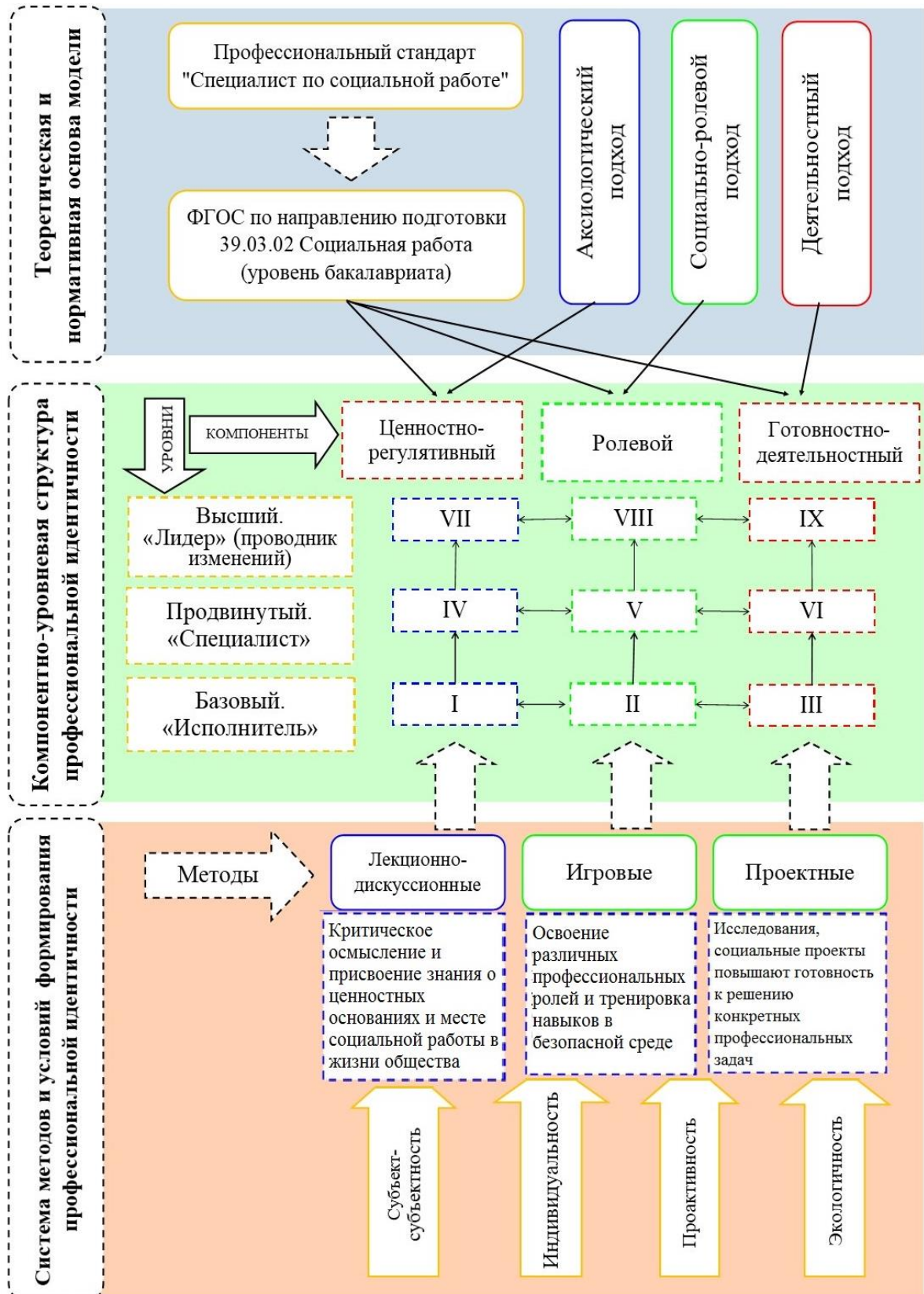
Рисунок 1. Модель формирования профессиональной идентичности бакалавров социальной работы

В нашей модели мы выделили три компонента профессиональной идентичности бакалавра социальной работы: готовностно-деятельностный, ролевой, ценностно-регулятивный, которые могут быть сформированы на трех уровнях: