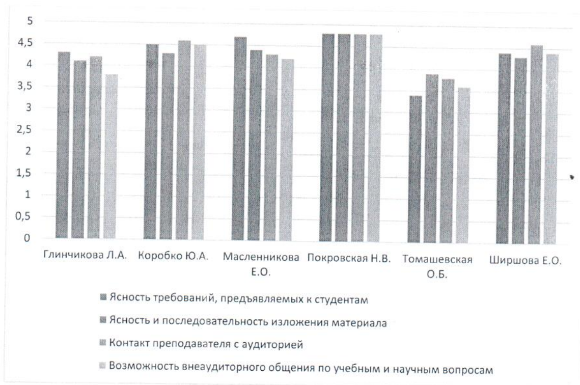
Рисунок 3. Диаграмма оценки качества преподавания учебных курсов преподавателями по образовательной программе