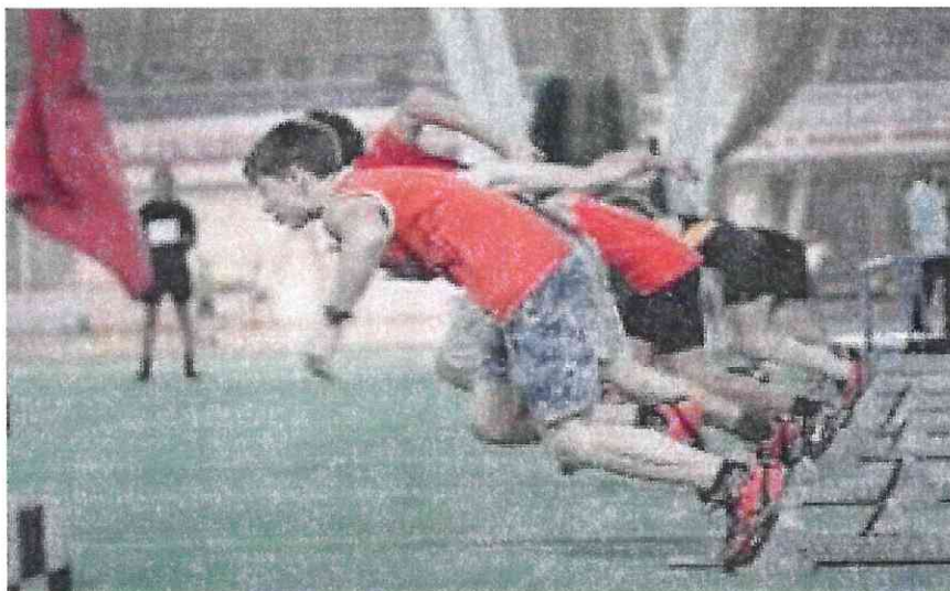
Рис. 3. Бег на 100 метров

При нарушении условий выполнения упражнений предоставляется вторая попытка, при повторном нарушении упражнение считается невыполненным.