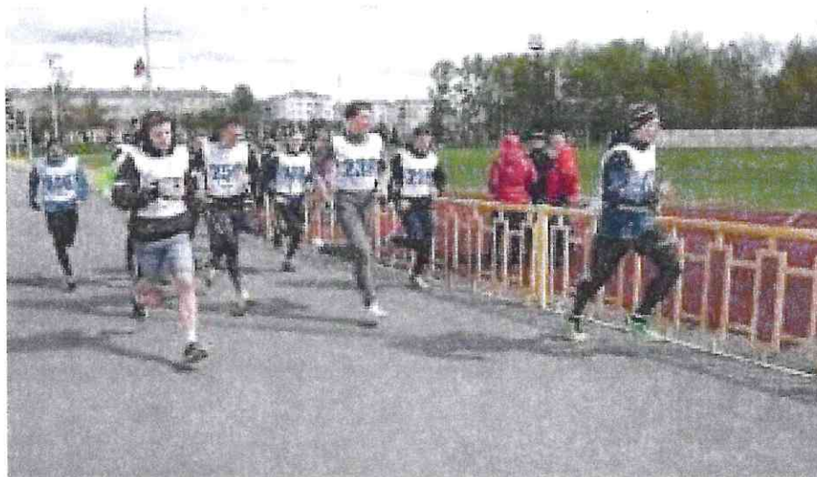
Рис. 3. Бег на 1 км, бег на 3 км

«НА СТАРТ» подойти к стартовой линии, по команде «МАРШ» начать бег. Старт и финиш, как правило, оборудуются в одном месте. При выполнении упражнений на беговой дорожке стадиона старт и финиш производится в соответствии с разметкой стадиона.