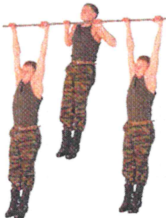
Рис. 2. Подтягивание на перекладине

Вис на перекладине (хват сверху, руки и тело прямые, ноги вместе, положение тела неподвижное), сгибая руки, подтянуться (подбородок выше грифа перекладины), разгибая руки, опуститься в вис. Положение вися фиксируется не менее 1 секунды (продолжить движение после объявления счета). Разрешается разводить ноги до ширины плеч и незначительно сгибать в тазобедренных и коленных суставах. Выполнение упражнения рывком и махом не допускается. Упражнение выполняется в спортивной форме одежды по команде «К СНАРЯДУ». При нарушении условий выполнения упражнения, повторение не засчитывается, подается команда «НЕ СЧИТАТЬ».