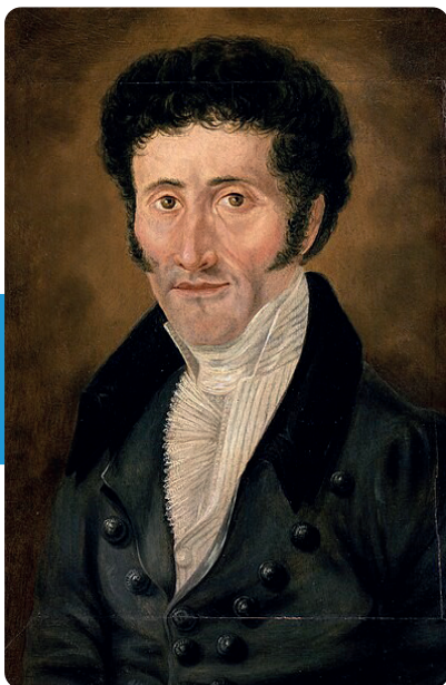
К 250-летию со дня рождения Э.Т.А. Гофмана (1776-1822)