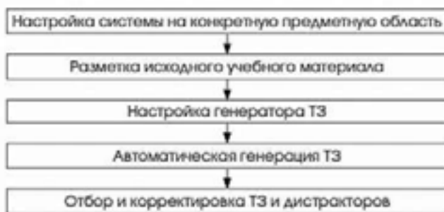
Рис 1. Название рисунка